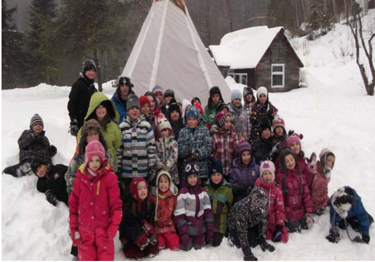
Lors de notre arrivée en avant du tipi