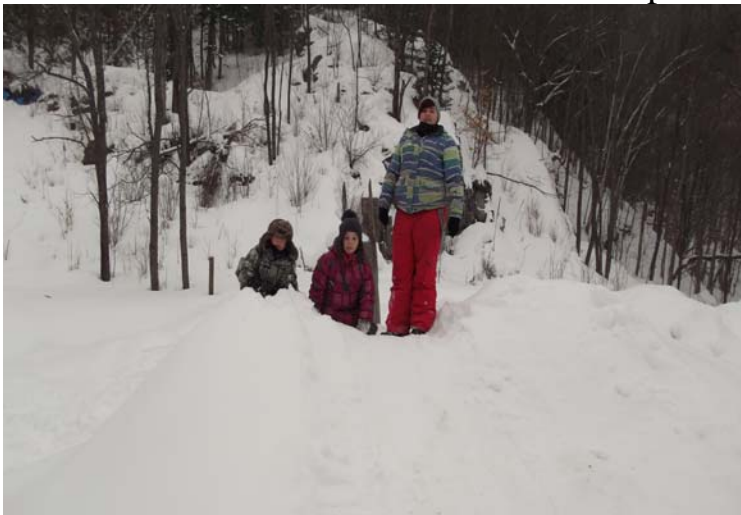
Quelques amis s'amuse à glisser