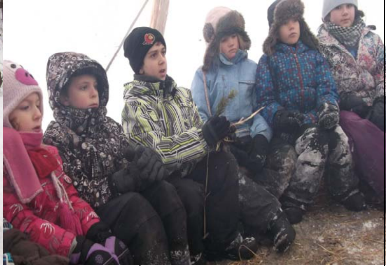
À l'intérieur du tipi