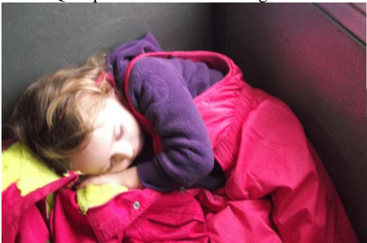
Après une journée si bien remplie, un repos bien mérité sur le chemin du retour.