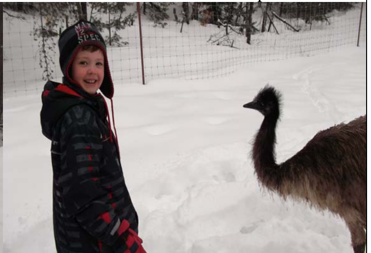
Un émeu a décidé de venir jouer avec nous