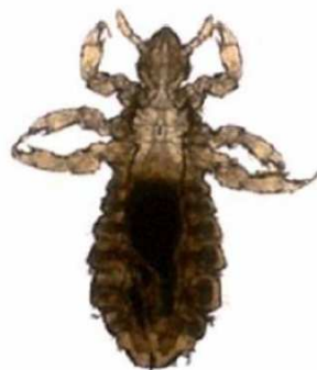
Poux de tête adulte

« Les poux sont associés à tort à un manque d'hygiène. Ils attaquent tout le monde, les riches comme les pauvres. Ils aiment autant les cheveux propres que les cheveux sales . »