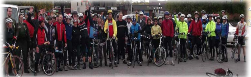
Cyclistes de la troisième édition, septembre 2012