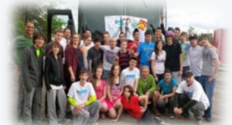
Équipe de coureurs au secondaire du GDPL 2013