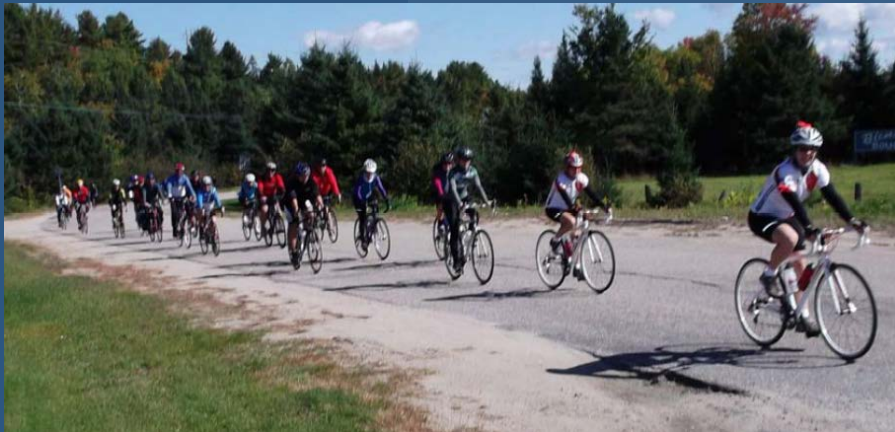
Cyclistes de la troisième édition, septembre 2012