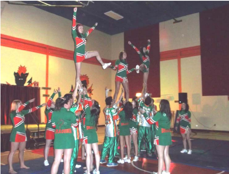
La soirée a été ponctuée d'une série de sketches, de séances d'improvisation, etc. Ici : une démonstration de cheerleading , par les membres de l'équipe de Gracefield.