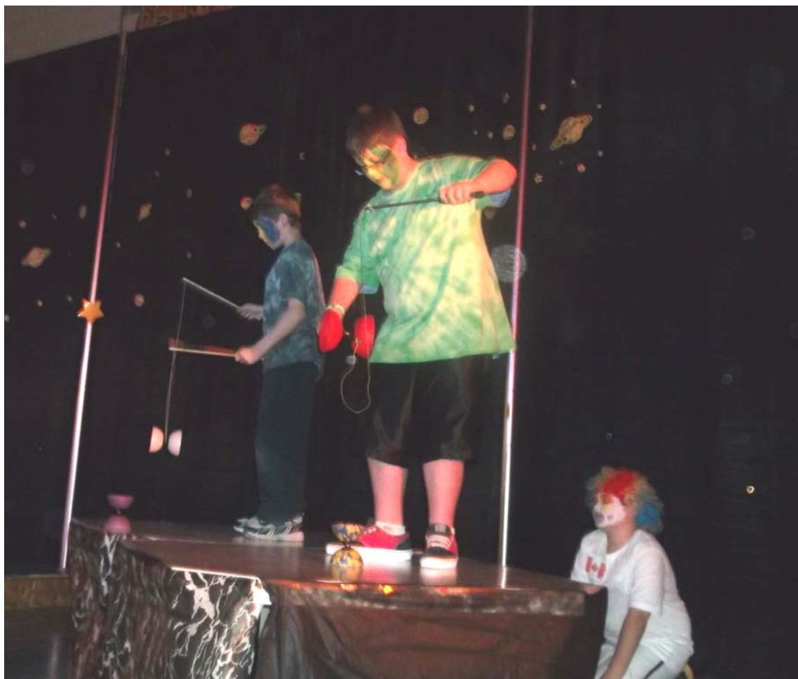
Démonstration de diabolos.