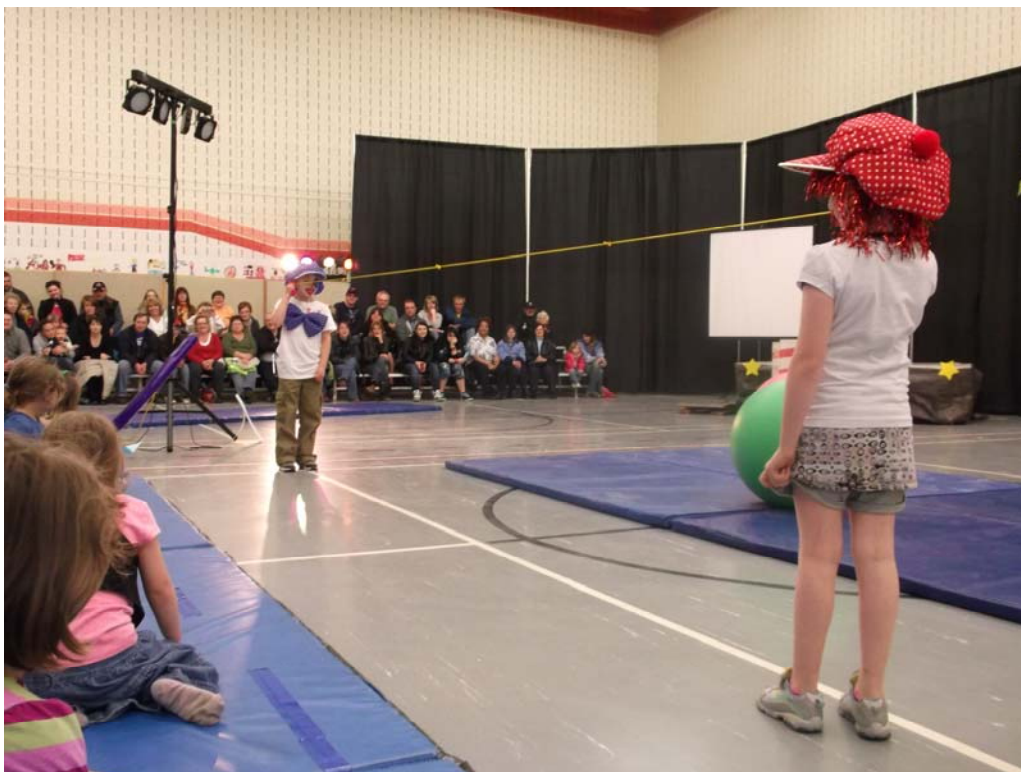
Les clowns, petits et grands, étaient à l'honneur.